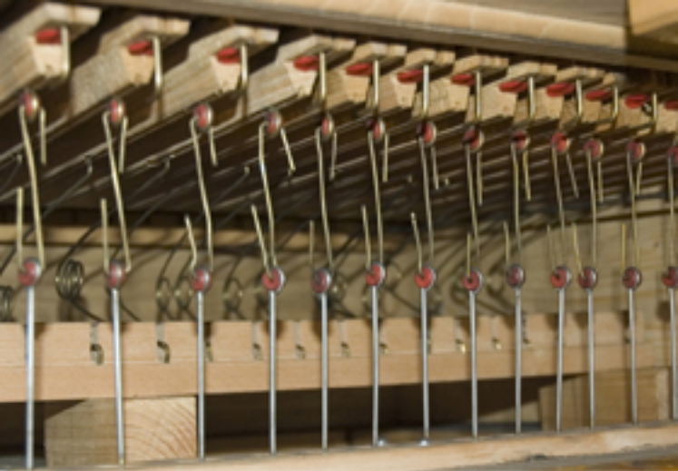
Spielventile in den Windladen